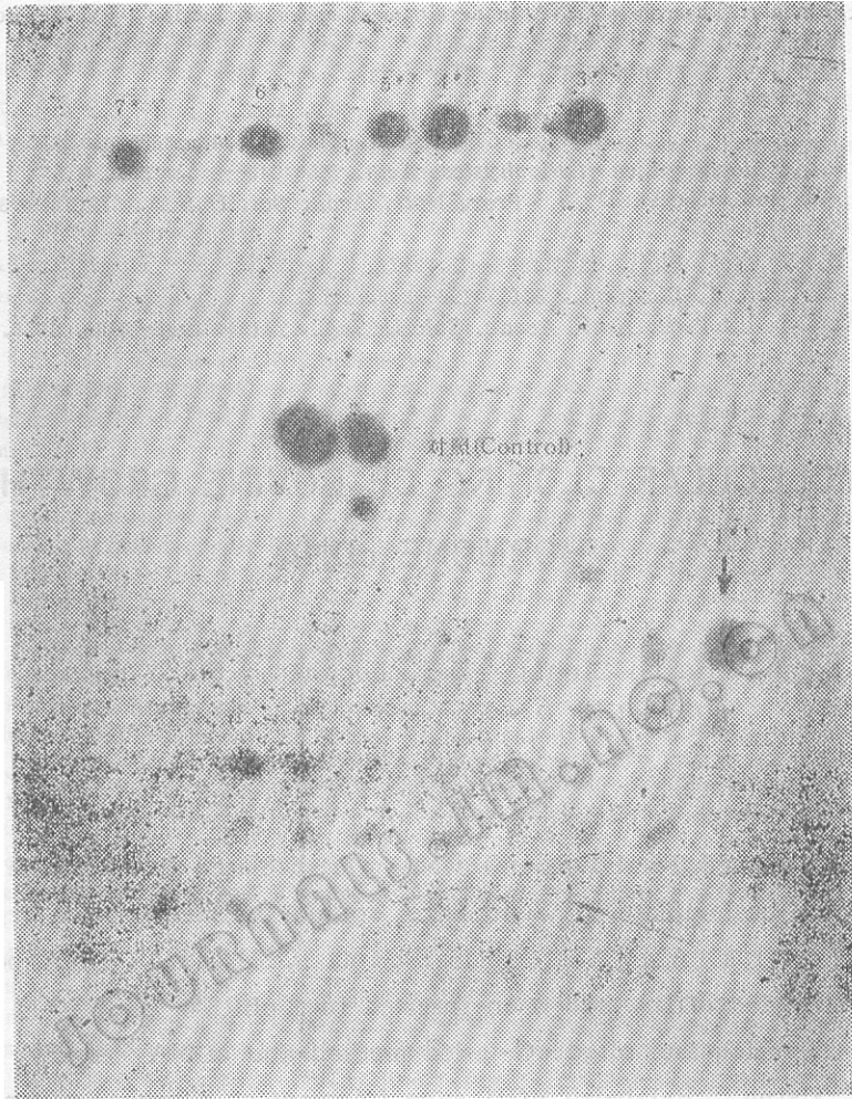
图2 用 ^{32}\text{P} 标记的牛生长激素基因为探针, 与生长在硝酸纤维素滤纸上含有外源DNA 克隆进行原位分子杂交, 有7个克隆为阳性

Fig. 2 Analysis by dot hybridization. Experimental condition were described in the materials and methods section. Seven cDNA clones were screened as: number 1(PbGH-1), 2(PbGH-2), 3(PbGH-3), 4(PbGH-4), 5(PbGH-5), 6(PbGH-6) and 7(PbGH-7)