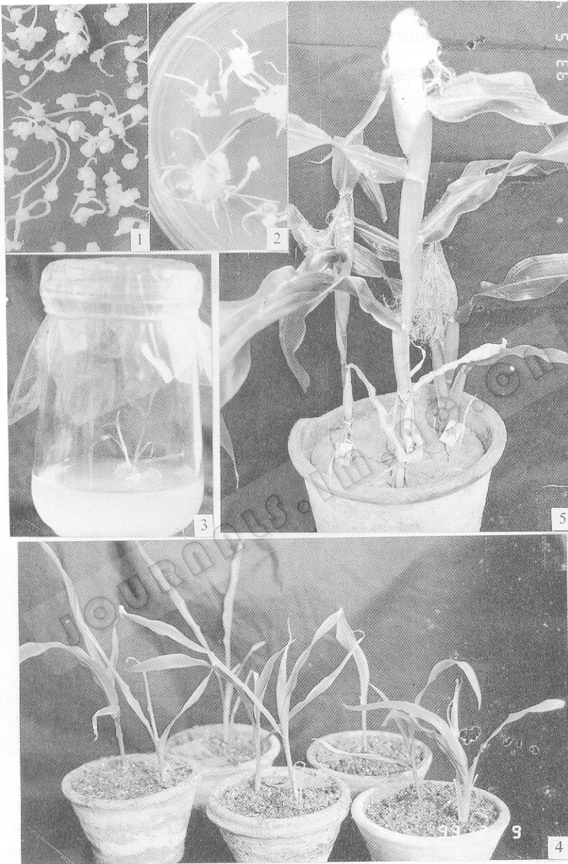
1. Selection of immature embryos on medium containing 25mg/L hygromycin B after microprojectile bombardment, 2. Regeneration of resistant calli, 3. Resistant calli-derived plantlets in N6 medium, 4. Transplantation of resistant calli-derived plant into small pots, 5. Transgenic maize plants with tassel ear.