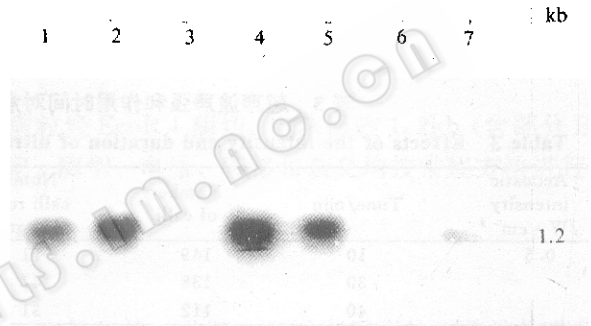
图2 基因枪轰击法获得的部分转基因植株 Southern 杂交分析

转化的玉米愈伤组织和植株分别经过点杂交和Southern吸印杂交,证明Bt毒蛋白基因已插入植物染色体组(图1,2)。对部分转基因植株后代的分析表明,转入的Bt基因可以通过有性生殖传递给后代(资料略)。